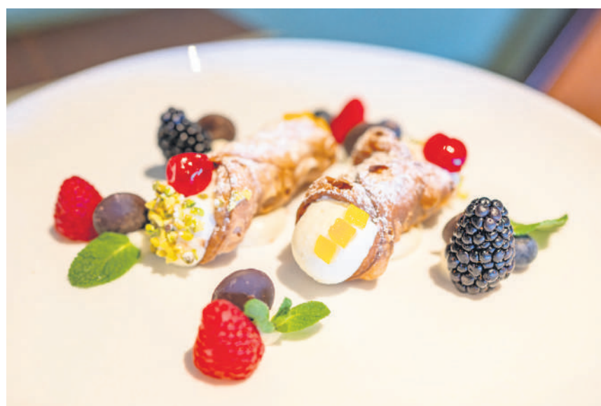
CANNOLO SICILIANO Knusprige Teigrollchen, gefüllt mit süsssem Ricotta und traditionell verfeinert mit Pistazien.

Zum perfekten Abschluss empfiehlt sich die Spezialität des Hauses: «Cannoli Siciliani» – knusprige Teigrollchen gefüllt mit cremigem, süsssem Ricotta, traditionell verfeinert mit Pistazien. Ein wahrer Genuss, der jedes Essen im Al Fiume perfekt abrundet.