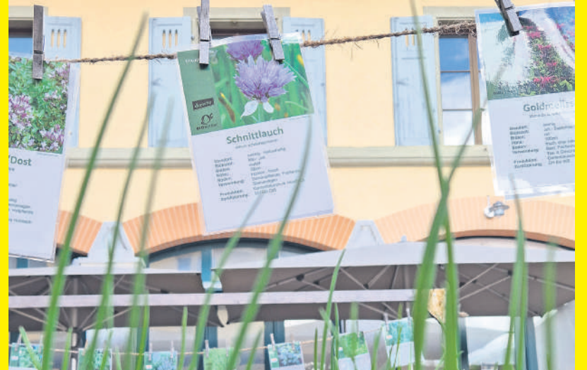
Die regionalen Gärtnereien bieten eine grosse Auswahl an unterschiedlichen Kräutern für den eigenen Vorrat direkt vor der Haustüre.

FrISCHE Gewürzkräuter sind vorab in der warmen Jahreszeit aus der Küche kaum wegzudenken. Mit wenigen Handgriffen kommt die Vorratskammer dazu gleich vor die Haustüre zu liegen.