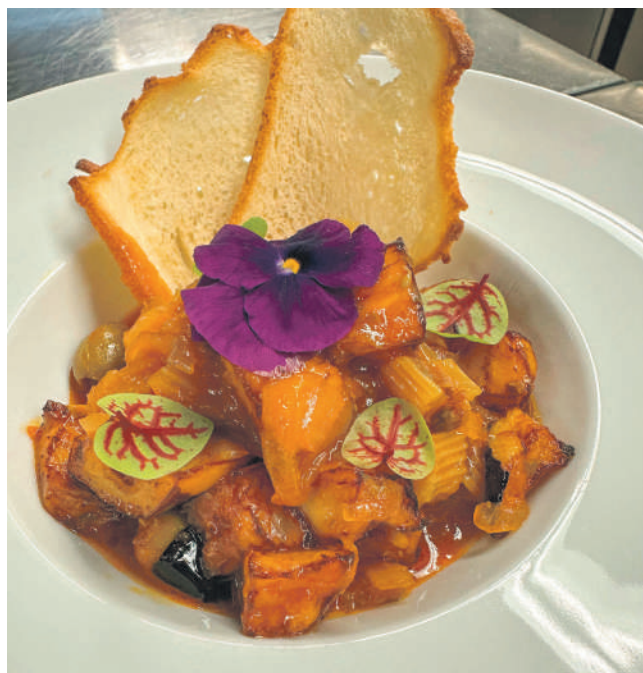
CAPONATA DI MELANZANA

Besondere Highlights auf der Karte sind die beliebte «Caponata di Melanzane», eine sorgfältig zubereitete Auberginenspezialität, oder der köstlich zarte «Polpo arrosto», gebratener Oktopuss mit Rosmarin und Kartoffelvariation. Ein absoluter Bestseller des Hauses ist das «Ossobucco alla Milanese», die klassische Kalbshaxe mit Safranrisotto, die die Gäste immer wieder begeistert. «Unsere Gäste schätzen besonders die Authentizität und Frische unserer Gerichte», ergänzt Marino mit einem stolzen Lächeln.